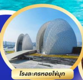
โรงละครหอยโขง