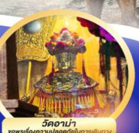
วัดอาน่า