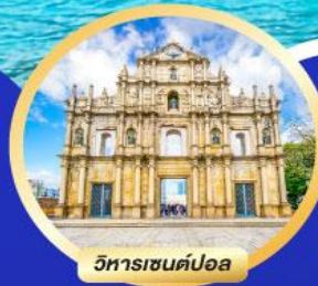
วิหารเซนต์ปอล