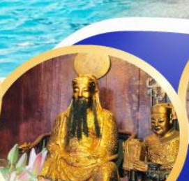
วัดกวนโก๋