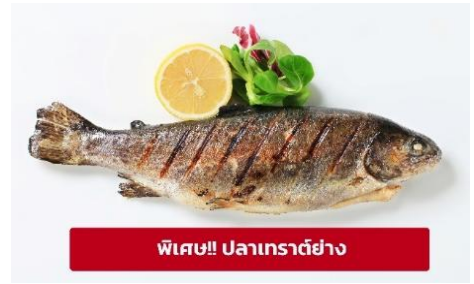
พิเศษ!! ปลาเทราต์ย่าง

นำท่านเดินทางสู่ เมืองมรดกโลกเชคที่ คุรมลอฟ (Cesky Krumlov) สาธารณรัฐเชค (ระยะทาง 210 กม./ 3.30 ชม.) ล้อมรอบด้วยแม่น้ำ Vltava ทำให้เมืองแห่งนี้มีลักษณะคล้ายหยดน้ำ จนถูกขนานนามว่าเป็น "เมืองหยดน้ำ" จากนั้นนำท่าน ถ่ายรูปบริเวณรอบนอก ปราสาทคุรมลอฟ (Cesky Krumlov Castle) เป็นปราสาทกอริคดั้งเดิม ตั้งอยู่ริมฝั่งแม่น้ำวัลตาวาบนแหลมหิน มีหอคอยสีชมพูหวานๆ ราวกับปราสาทเจ้าหญิงในนิยาย มีอายุกว่า 700 ปี เคยเป็นคฤหาสน์ส่วนตัวของขุนนางถึง 3 ตระกูล ก่อนจะตกเป็นสมบัติของรัฐบาล นำท่านเดินทางสู่ เมืองเชสเก บูเดโจวีช (Ceske Budejovice) (ระยะทาง 26 กม./ 30 นาที) ตั้งอยู่บนฝั่งแม่น้ำวัลตาวา และเป็นเมืองต้นกำเนิดของเบียร์บุดไวเซอร์