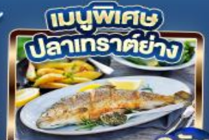
เมนูพิเศษ ปลาเทราต์ย่าง

เยอรมัน ออสเตรีย เช็ก สโลวาเกีย ฮังการี ยอดเขา Zugspitze Top of Germany