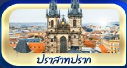
ปราสาทปราก

ท่ามกลางยอดเขา Zugspitze เยือนเมืองมิวนิค จัดธุริสมาเรียนพลาทซ์ สัมผัสเมืองมรดกโลก เซสท์ ครุมลอฟ เยี่ยมชมปราสาทปราก เช็กอินปราสาทบราติสลาวา ล่องเรือชมความงามแม่น้ำดานูบ ชมความน่าหลงใหลของ ปราสาทบูดาเปสต์ เที่ยวชมหมู่บ้านริมหทะเลสาบอัลส์สติกท์ พระราชวังเซินบรุนน์ สวนมิราเบล