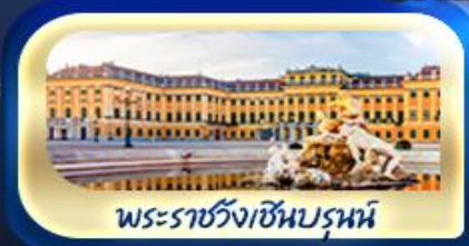
พระราชวังเซินบรุนน์

ท่ามกลางยอดเขา Zugspitze เยือนเมืองมิวนิค จัดธุริสมาเรียนพลาทซ์ สัมผัสเมืองมรดกโลก เซสท์ ครุมลอฟ เยี่ยมชมปราสาทปราก เช็กอินปราสาทบราติสลาวา ล่องเรือชมความงามแม่น้ำดานูบ ชมความน่าหลงใหลของ ปราสาทบูดาเปสต์ เที่ยวชมหมู่บ้านริมหทะเลสาบอัลส์สติกท์ พระราชวังเซินบรุนน์ สวนมิราเบล