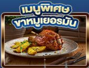
เมนูพิเศษ ทาหมูเยอรมัน

เยอรมัน ออสเตรีย เช็ก สโลวาเกีย ฮังการี ยอดเขา Zugspitze Top of Germany