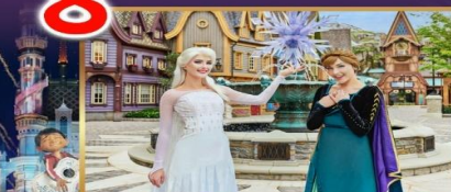
WORLD OF FROZEN