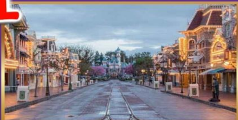
MIAN STREET USA