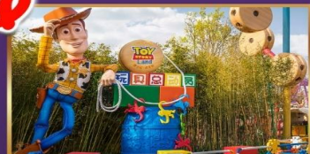
TOY STORY LAND