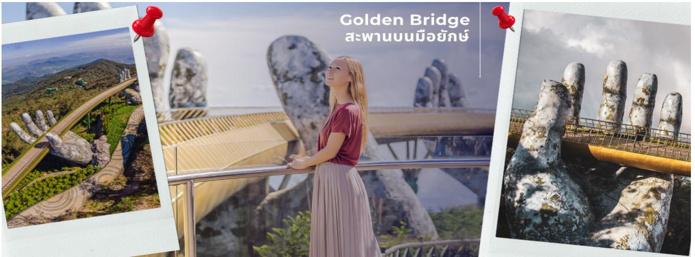
Golden Bridge สะพานบนมือยักษ์

CFDD5 ดานัง-ฮอยอัน-พักบานาฮิลล์ 3 วัน 2 คืน FD (MAY-OCT25)