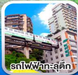
รถไฟฟ้ากะลุดัก