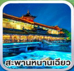
สะพานหนานเจียว