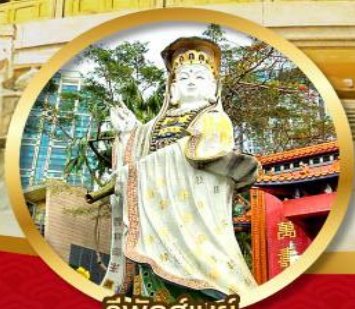
รีพัลส์เบย์