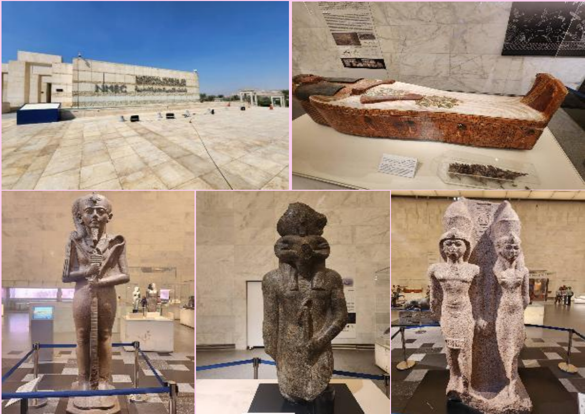
VEG53G9-4 ฟาโรห์ ไครไม่หีบ อียิปต์ 5D3N By G9

เช้า รับประทานอาหารเช้า ณ ห้องอาหารของโรงแรม นำท่านเดินทางสู่ พิพิธภัณฑ์อารยธรรมอียิปต์แห่งชาติ (NATIONAL MUSEUM OF EGYPTIAN CIVILIZATION : NMEC) ตั้งอยู่ในตัวเมืองกรุงไคโร เป็นพิพิธภัณฑ์แห่งใหม่ของอียิปต์ เปิดให้เข้าอย่างเป็นทางการเมื่อวันที่ 04 เมษายน พ.ศ. 2564 ปัจจุบันเป็นที่ตั้งของมัมมี่พระศพฟาโรห์และพระราชินีแห่งอียิปต์ ภายหลังการ เคลื่อนย้ายมัมมี่มาจากพิพิธภัณฑ์เดิมในขบวนพาเหรด PHAROAH'S' GOLDEN PARADE เมื่อเดือน เม.ย. 2564 ภายในพิพิธภัณฑ์มีการแสดงโบราณวัตถุที่จัดแสดง ในโถงนิทรรศการหลักมีกว่า 1,500 ชิ้น จัดแสดงเสื้อผ้าแบบดั้งเดิม, แบบจำลองเรือโบราณ นอกจากรูปปั้นและสิ่งของฟาโรห์แล้วห้องโถงใหญ่ยังมีโครงกระดูกมนุษย์ที่มีอายุย้อนกลับไป 35,000 ปีแสดงให้เห็นถึงชาวอียิปต์โบราณมีความก้าวหน้าใน ด้านการแพทย์