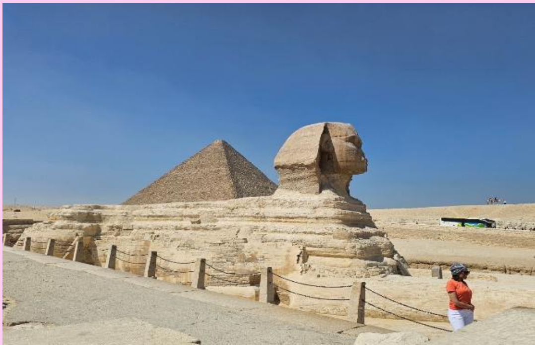
VEG53G9-4 ฟาโรห์ ใครไม่หิบบ สีลิปต์ 5D3N By G9

• ส่วนซ้ายสุดขนาดเล็กกว่าองค์อื่น คือ พีระมิดของฟาโรห์เมนคูเร MENKAURE มีขนาดเล็กที่สุด มีความสูง 65 เมตรและมีพีระมิดของราชินีอีกสามหลัง ฟาโรห์เมนคูเร คือลูกชายของฟาโรห์คาเฟรและเป็นหลานของฟาโรห์คูฟู) จากนั้นนำท่านเดินทางถ่ายภาพด้านหน้า มหาสฟิงซ์ (THE GREAT SPHINX OF GIZA) (ใช้ระยะเวลาเดินทางประมาณ 10 นาที) มหาสฟิงซ์ ตั้งอยู่ด้านหน้าของพีระมิดคาเฟร ซึ่งเป็นส่วนหนึ่งของหมู่พีระมิดแห่งกิซา และยังถือเป็นสฟิงซ์ที่มีขนาดใหญ่ที่สุดในโลก แกะสลักจากเนินหินธรรมชาติเพียงก้อนเดียว มีส่วนหัวเป็นพระพักตร์ของฟาโรห์และลำตัวเป็นสิงโต มีหน้าที่เปรียบเสมือนเป็นตัวแทนของกษัตริย์ และมีพลังพิเศษเพื่อปกป้องพระศพและทรัพย์สมบัติที่อยู่ภายในพีระมิด