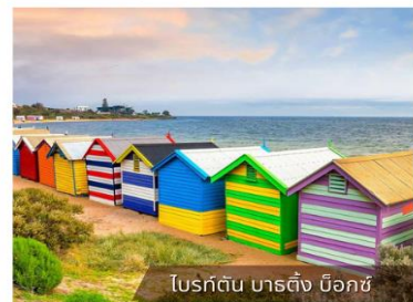
โบรคตัน บาร์ดิง บ็อกซ์