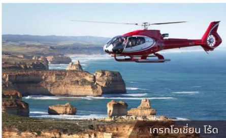
เครกโฮเชียน ไรด์