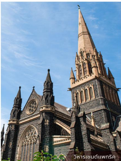
วิหารเซนต์แพทริค