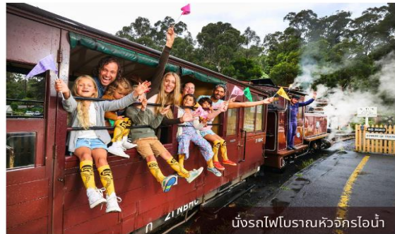
นั่งรถไฟโบราณหัวจักรไอน้ำ