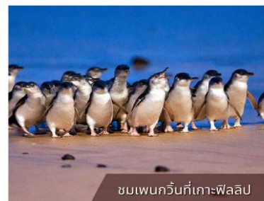
ชมเพนกวินที่เกาะฟาสลิป