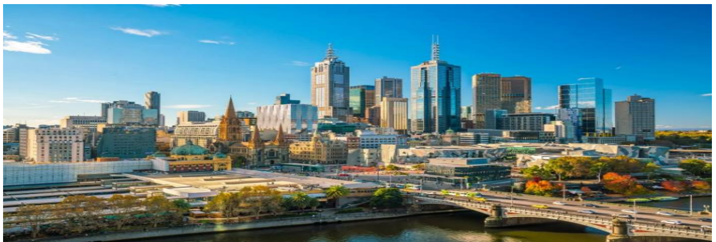
BIG... Highlight Melbourne 5D3N by JQ SEP – NOV 2025

09.20 เดินทางถึงท่าอากาศยานเมลเบิร์น ประเทศออสเตรเลีย นำท่านผ่านพิธีตรวจคนเข้าเมืองหลังจากนั้นนำท่านเดินทางเข้าสู่ตัวเมืองเมลเบิร์น นำท่าน ชมเมืองเมลเบิร์น เป็นเมืองที่มีความตื่นตาตื่นใจด้วยการผสมผสานทั้งความเก่าและความใหม่เข้าด้วยกัน เป็นเมืองหลวงที่ตั้งอยู่บนริมฝั่งแม่น้ำ Yarra มีสวนสาธารณะริมน้ำ มีสถาปัตยกรรมของยุคต้นทงในสมัยกลางศตวรรษที่ 18 คละเคล้ากับตึกสูงระฟ้าในสมัยปัจจุบันทำให้มีภูมิทัศน์ของเมืองที่ไม่เหมือนใคร มีแม่น้ำตั้งอยู่ใจกลางเมืองอันเป็นเสน่ห์ของเมลเบิร์น นำท่านชม วิหารเซนต์แพทริก (St.Patrick's Cathedral, Melbourne) เป็นวิหารในศาสนาคริสต์นิกายโรมันคาทอลิกที่ใหญ่ที่สุดในรัฐวิกตอเรีย โดย James Goold ผู้เป็นบิซ๊อปท่านแรกแห่งเมืองMelbourne ต่อมาได้เป็นบิซ๊อปแห่งออสเตรเลียคนที่ 4 มีคำริให้ William Wardell ผู้เป็นทั้งนักบวชและสถาปนิกที่สำคัญแห่งเมืองนี้เป็นผู้ออกแบบและควบคุมการก่อสร้างทั้งหมดอาศัย