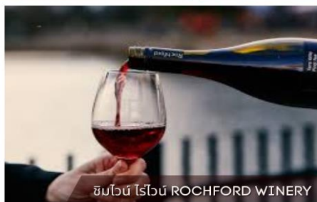
ชิมไวน์ ไวน์ ROCHFORD WINERY