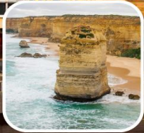
เกรท โอเซียนโร้ด