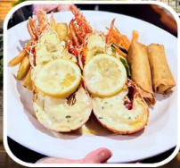
เมนูพิเศษกึ่งลือบสเตอร์