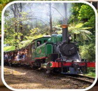
รถไฟหัวจักรไอน้ำ