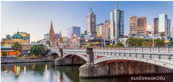
ชมเมืองเมลเบิร์น