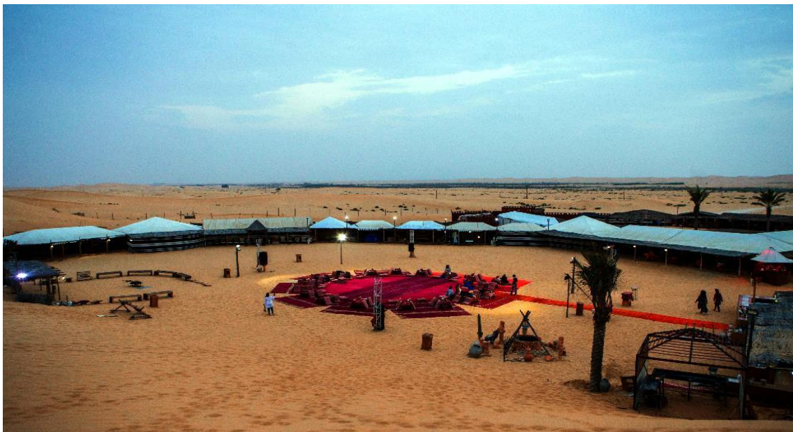
VUAEG9-1 ตูโฉบมันว้าวมาก 5วัน 3คืน By G9