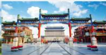
ถนนโบราณเฉียนเหมิน