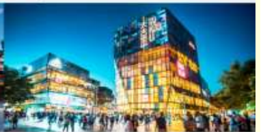
ย่านซุนหลี่ตุ่น

*ทางบริษัทฯ ขอสงวนสิทธิ์ในการสลับโปรแกรมทัวร์ตามความเหมาะสมขึ้นอยู่กับสถานการณ์หน้างาน โดยคำนึงถึงผลประโยชน์ของลูกค้าเป็นสำคัญ