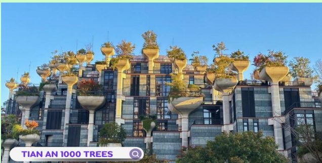
TIAN AN 1000 TREES