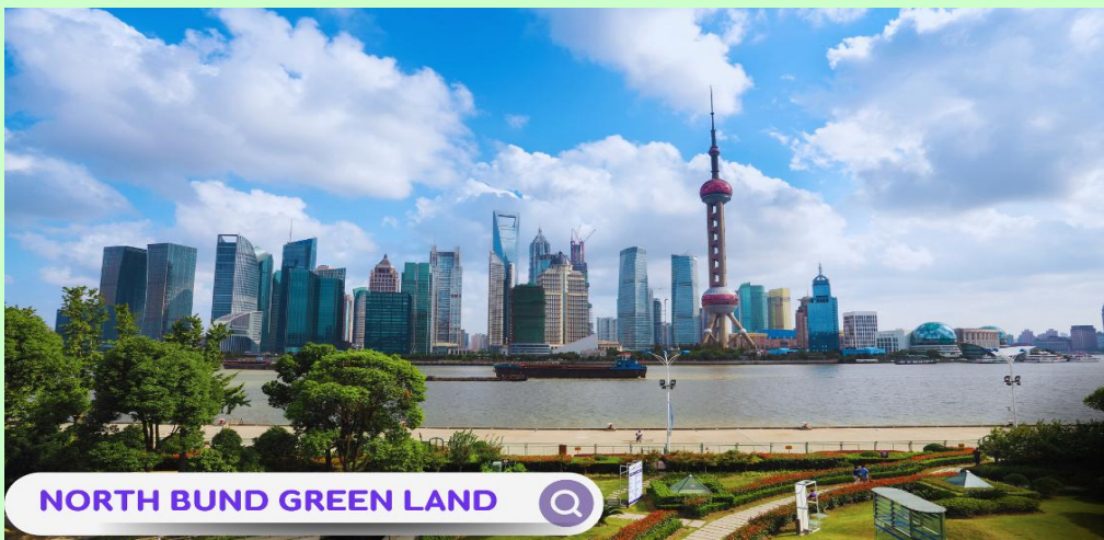
NORTH BUND GREEN LAND

เมืองเซี่ยงไฮ้ เมืองที่ใหญ่ที่สุดของจีน มีท่าเรือที่มีจำนวนเรือคับคั่งที่สุดในโลก และมีคนอาศัยอยู่อย่างหนาแน่นมากที่สุดในจีน ที่ผสมผสานความเป็นเมืองเก่าและเมืองใหม่ได้อย่างลงตัว นำท่านเดินทางสู่ ย่านลู่เจียจู่ย Sky Walk จุดเซ็คอิน และถ่ายรูปบนสะพานลอย และอีก 1 แลนด์มาร์คที่ท่านต้องถ่ายรูปเมื่อมาถึงเมืองเซี่ยงไฮ้นั้นคือ หอไข่มุก เป็นหอส่งสัญญาณวิทยุโทรทัศน์สูง 468 เมตร ลักษณะเป็นไข่มุก 11 ลูก และเสา 3 เสา ด้านบนเป็นรูปไข่มุก 3 เม็ด 3 ขนาดเรียงกันในแนวตั้งไม่ขึ้นตึก