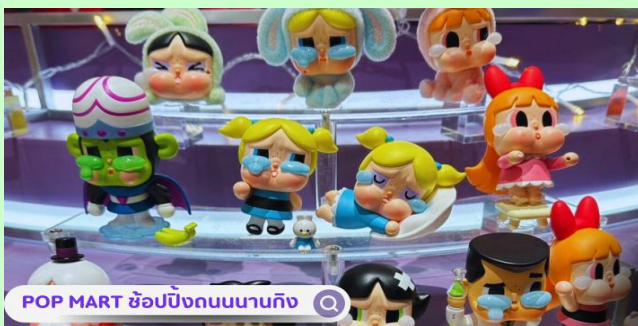
POP MART ซ้อปิงถนนนาทิง