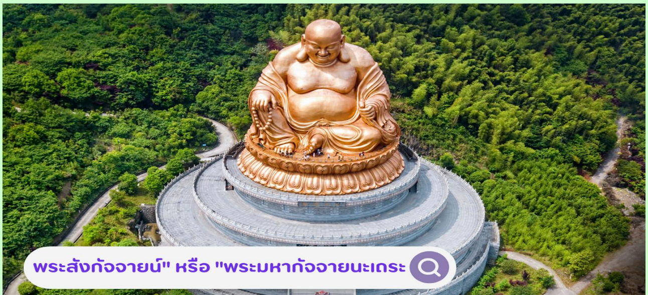
พระสังกัจจายน์" หรือ "พระมหากัจจายนะเถระ 🔍

นำท่านชม วัดเสวียโต้วซาน ตั้งอยู่ในเมืองหนิงโป มณฑลฝูเจี้ยน ตั้งอยู่ที่เชิงเขาเซาโต้ว (Xuedou Mountain) วัดนี้มีชื่อเสียงในฐานะสถานที่ศักดิ์สิทธิ์สำหรับการศึกษาพุทธศาสนา การและสถานที่ฝึกฝนและปฏิบัติธรรมตามหลักของพระศรีอาริยเมตไตรย ซึ่งเป็นพระโพธิสัตว์ที่สำคัญในศาสนาพุทธ ที่วัดมีพระพุทธรูปขนาดใหญ่ที่ตั้งอยู่กลางแจ้ง "พระสังกัจจายน์" หรือ "พระมหากัจจายนะเถระ" ขนาด 33 เมตร เมตร มีลักษณะที่งดงามและประณีต พระพุทธรูปนี้สร้างขึ้นด้วยวัสดุที่ทนทานและมีความสวยงามทางศิลปะ เป็นพระโพธิสัตว์ที่สำคัญในศาสนาพุทธ พระองค์เป็นสัญลักษณ์ของความเมตตาและการกรุณา และถูกเคารพสักการะว่าเป็นพระโพธิสัตว์ รอที่จะมาตรัสรู้เป็นพระพุทธเจ้าองค์ถัดไปเมื่อสิ้นพุทธกาลของสมเด็จพระสัมมาสัมพุทธเจ้า นอกจากนี้ยังมีสถานที่อื่น ๆ ในวัดที่น่าสนใจ เช่น หอพระธรรม พิพิธภัณฑ์ และสวนและทางเดินที่สวยงาม