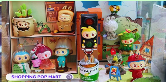
SHOPPING POP MART