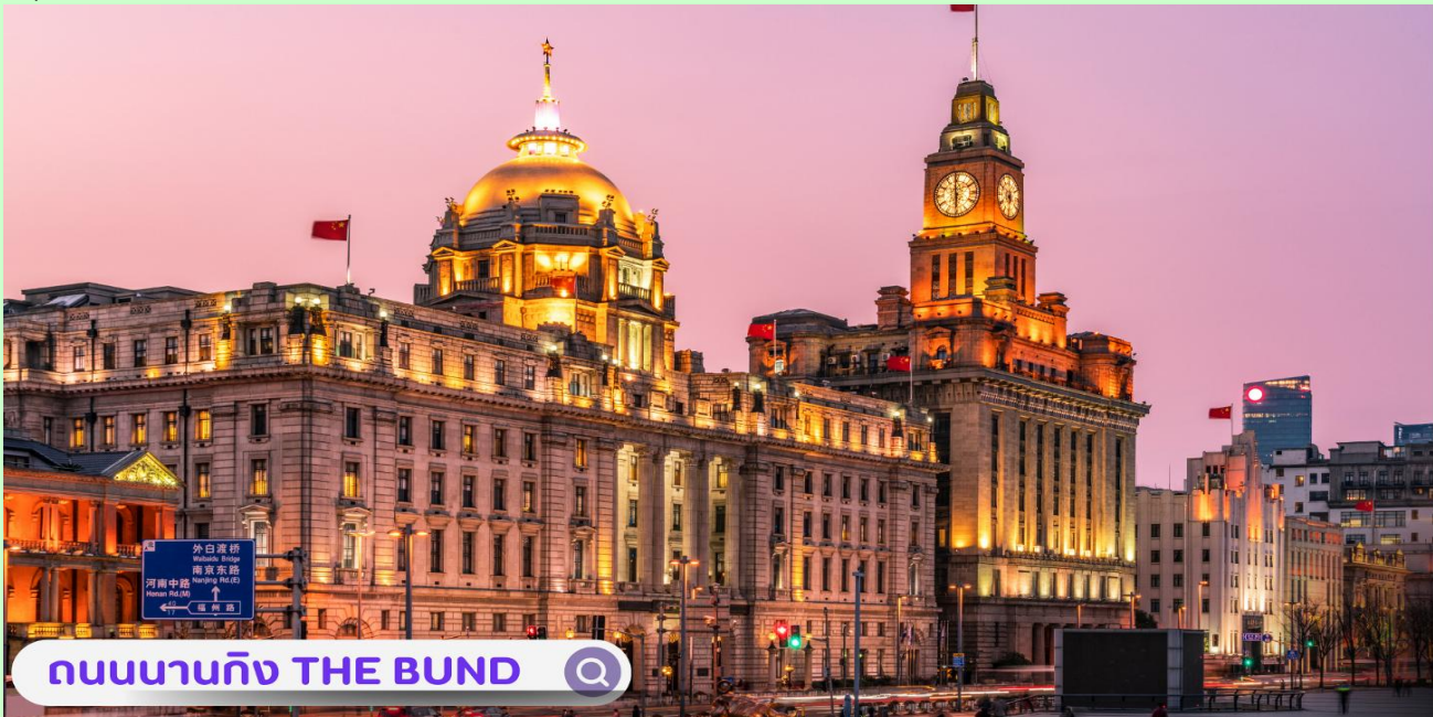
ถนนนาทิง THE BUND