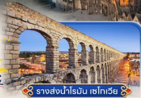
รางส่งน้ำโรมัน เซโกเวีย