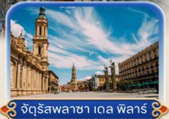
จัตุรัสพลาซ่า เดล ฟ็อลร์