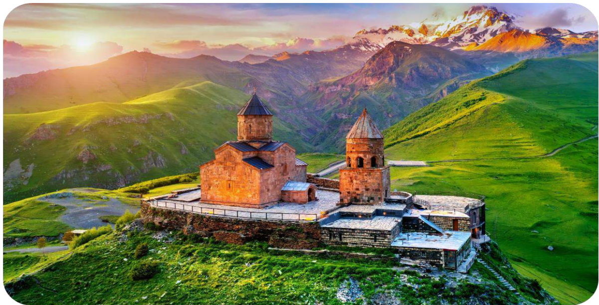
หน้าที่ 6 . ***ภาพประกอบใช้เพื่อการโฆษณาเท่านั้น***

นำท่านเปลี่ยนการเดินทางเป็นรถจี๊ป 4WD เพื่อเดินทางไปชมความงามของ โบสถ์เกอร์เกตี (GERGETI TRINITY CHURCH) ซึ่งถูกสร้างขึ้นในราวศตวรรษที่ 14 หรือมีอีกชื่อเรียกกันว่า ทสมินดา ซามีบา (TSMINDA SAMEBA) ซึ่งเป็นชื่อที่เรียกที่นิยมกันของโบสถ์ศักดิ์แห่งนี้สถานที่แห่งนี้ตั้งอยู่ริมฝั่งขวาของแม่น้ำชคเฮรี อยู่บนเทือกเขาของคาซเบกกี ซึ่งเป็นไฮไลท์ของประเทศจอร์เจียที่หิมะขึ้นอยู่กัับสภาพอากาศ (การเดินทางโดย 4WD มายังสถานที่แห่งนี้ ขึ้นอยู่กับสภาพดิน ฟ้า อากาศ ซึ่งอาจจะถูกปิดกั้นได้ด้วยหิมะที่ปกคลุมอยู่ และการเดินทางอาจจะเป็นอุปสรรคได้ **ขอสงวนสิทธิไม่มีการคืนค่าใช้จ่ายในกรณีเดินทางไม่ได้เนื่องจากสภาพอากาศ** )