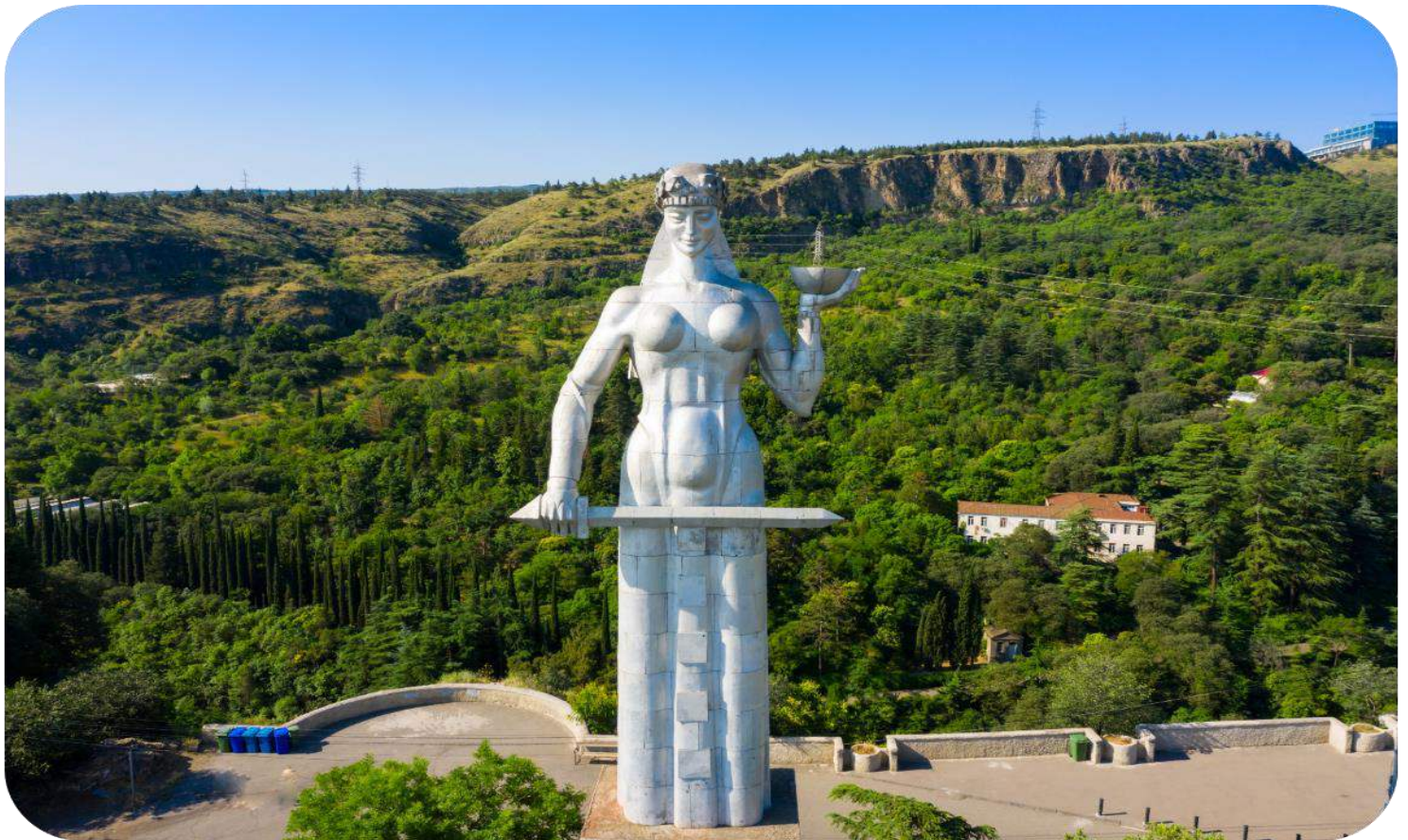
หน้าที่ 12 . ***ภาพประกอบใช้เพื่อการโฆษณาเท่านั้น***

แวะถ่ายรูป สะพานแห่งสันติภาพ เป็นสะพานคนเดินรูปโค้ง โครงสร้างเหล็กและกระจกที่ส่องสว่างด้วยไฟ LED จำนวนมาก เหนือแม่น้ำคูรา เชื่อมสวนสาธารณะกับเมืองเก่าในใจกลางเมืองทбилиซี นำท่านเดินทาง ชั้นกระเช้าไฟฟ้าป้อมนาริคาล่า (NARIKALA FORTRESS) ให้ท่านได้ชมป้อมปราการซึ่งเป็นป้อมโบราณที่ถูกสร้างในราวศตวรรษที่ 4 ใน รูปแบบของซุริส ทซิเค อันหมายถึงรูปแบบที่ไม่มีควมสม่ำเสมอ และต่อมาในราวศตวรรษที่ 7 สมัยของราชวงศ์อุมัยยาดได้มีการก่อสร้างต่อขยายออกไปอีกและต่อมาในสมัยของกษัตริย์เดวิด (ปีค.ศ.1089-1125) ได้มีการสร้างเพิ่มเติมขึ้นอีก ซึ่งต่อมาเมื่อพวกมองโกลได้เข้ามายึดครอง ก็ได้เรียกชื่อป้อมแห่งนี้ว่า นารินกาลา (NARIN QALA) ซึ่งมีความหมายว่า ป้อมอันเล็ก (LITTLE FORTRESS) และต่อมาบางส่วนได้พังทลายลง เพราะว่าเกิดแผ่นดินไหวและได้ถูกรื้อทำลาย นำท่านถ่ายรูป มารดาแห่งจอร์เจีย (MOTHER OF GEORGIA) อนุสาวรีย์สัญลักษณ์สำคัญที่ตั้งตระหง่านอยู่ใจกลางเมืองราวกับกำลังเฝ้ามองผู้คน มีอีกชื่อหนึ่งคือ มารดาคาร์ทลิส และ คาร์ทลิส เดดา เป็นประติมากรรมที่ตั้งอยู่บนยอดเขาโซโลลาภิเพื่อฉลองที่ทбилиซีครอบรอบ 1,500 ปี