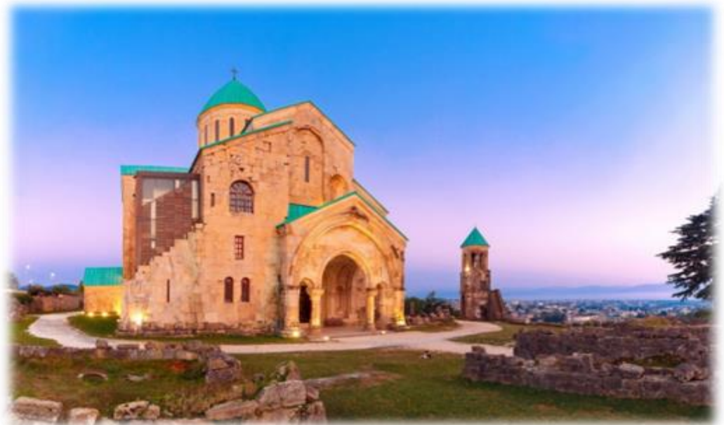
หน้า 7 (ภาพใช้เพื่อการโฆษณาเท่านั้น)

จากนั้นนำท่านเดินทางสู่เมืองคุไตซี เพื่อชม วิหารบากราติ (Bagrati Cathedral) ซึ่งเป็นโบสถ์ที่เจียบสงบแลสวยงามอยู่ ภายนอกโบสถ์มีไม้กางเขนอันใหญ่ที่มีความโดดเด่นอยู่ด้านหน้า และด้วยตำแหน่งที่ตั้งที่อยู่บนเนินเขา ทำให้มองเห็นวิวของตัวเมืองด้านล่างได้อย่างชัดเจน ตัวโบสถ์สร้างจากหินอ่อนและด้านบนของโบสถ์ทำเป็นหน้าต่าารอบด้านทำให้แสงอาทิตย์ส่องผ่านเข้ามาภายในโบสถ์ได้ เกิดเป็นลำแสงที่สวยงาม ประกอบกับอากาศในช่วงเดือนกรกฎาคมที่เย็นสบาย ทำให้เราสามารถเดินชมโบสถ์และบรรยากาศโดยรอบได้อย่างสบาย ๆ