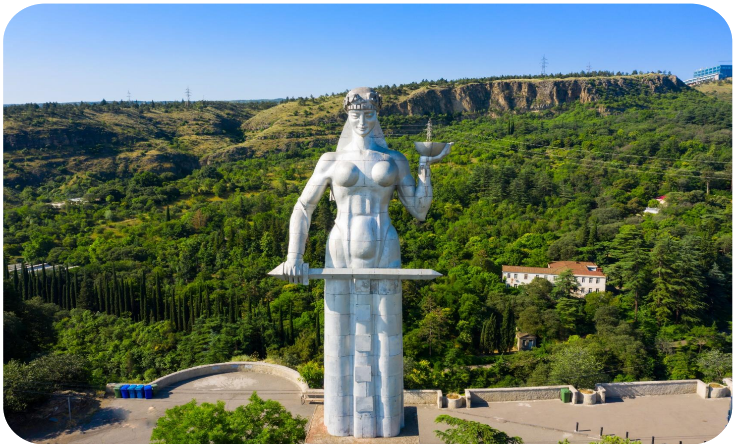
หน้า 16 (ภาพใช้เพื่อการโฆษณาเท่านั้น)

โรงอาบน้ำโบราณ อะบาโนตูบानी (ABANOTUBANI SULFUR BATHS) ด้วยความที่เมืองทบิลีซีนั้นมีบ่อน้ำพุร้อนเป็นจำนวนมาก แต่โรงอาบน้ำแห่งนี้เป็นโรงอาบน้ำโบราณแห่งนี้ใช้เป็นสถานที่สำหรับแช่น้ำพุร้อน ที่มีส่วนผสมของแร่กำมะถัน ซึ่งเชื่อกันว่าในน้ำพุร้อนมีแร่ธาตุต่าง ๆ ที่ช่วยกำจัดของเสียและทำให้ผิวพรรณเปล่งปลั่ง โรงอาบน้ำร้อนแห่งนี้ได้เปิดให้บริการมาอย่างยาวนาน และในปัจจุบันยังคงเปิดให้บริการกันอยู่