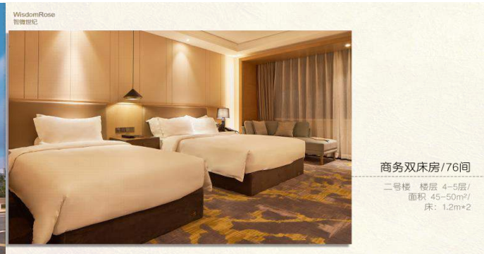
商务双床房/76间 二号楼 楼层 4-5层/ 面积 45-50m 2 / 床: 1.2m*2