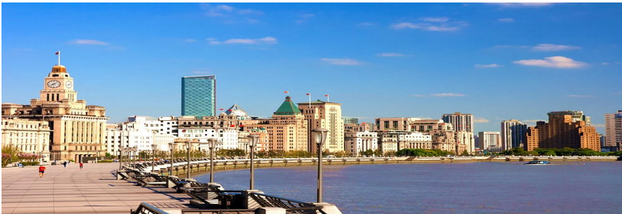
SHA01 MIRACULOUS LAND เซี่ยงไฮ้ ดิสเนย์แลนด์ 4 วัน 3 คืน (VZ)เม.ย.-ก.ย.68

นำท่านเดินเที่ยวชม หาดไวท์ตัน เป็นย่านถนนที่เลาะเลียบบแม่น้ำหวงผู่ ยาวประมาณ 1.5 กิโลเมตร เรียงรายด้วยอาคารที่มีสถาปัตยกรรมที่โดดเด่นในสไตล์แบบตะวันตกโบราณที่มี อายุกว่า 100 ปี ตึกเหล่านี้ในอดีตเคยเป็นที่ตั้งของบริษัทยักษ์ใหญ่ ธนาคารชั้นนำ กงสุล ของประเทศต่างๆ เป็นต้น อาคารเก่าแก่สไตล์ยุโรปเหล่านี้เรียกว่า เดอะบันด์ (The Bund) ซึ่งได้รับการอนุรักษ์ให้คงสภาพเดิมไว้เป็นอย่างดี ปัจจุบันได้ถูกดัดแปลงให้เป็นสำนักงาน ร้านอาหารสุดหรูที่ให้นักท่องเที่ยวได้สัมผัสบรรยากาศแบบตะวันตก และที่นี่เป็นสถานที่ที่ เคยถ่ายทำภาพยนตร์ยอดเยี่ยมอย่าง “เจ้าพ่อเซี่ยงไฮ้” จึงทำให้ที่นี่มีอีกชื่อเรียกว่า “หาดเจ้าพ่อ เซี่ยงไฮ้” ที่นี่ถือว่าเป็นแลนด์มาร์กที่ห้ามพลาด ความสวยงามและบรรยากาศของ สถาปัตยกรรมที่ผสมผสานกันทั้งแบบเก่า-ใหม่ และบรรยากาศริมแม่น้ำหวงผู่ ทำให้ควรค่า กับการมาเดินชิลเพื่อชมวิวที่สวยงามที่สุดในเมืองเซี่ยงไฮ้