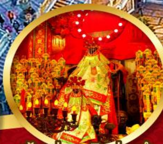
เจ้าแม่กวนอิมฮ่องกง นมัสการองค์เจ้าแม่กวนอิม อายุกว่า 600 ปี