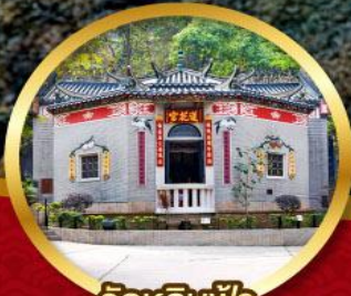
วัดหลินฟ้า โชคลาภ และ ความมั่งคั่ง