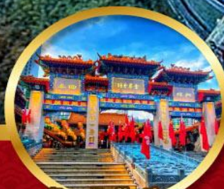
วัดหวังตักเซียน ขอพรด้านสุขภาพ