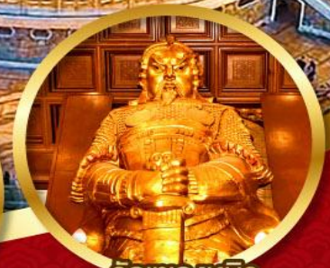
วัดเข่งหีบิว ขอพรโชคลาภ การเงิน และ ธุรกิจ