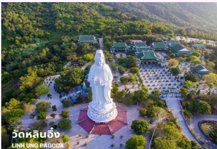
วัดหลินอึ้ง LINH UNG PAGODA

เช้า รับประทานอาหารเช้า ณ ห้องอาหารของโรงแรม