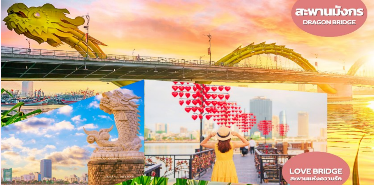
สะพานมังกร DRAGON BRIDGE