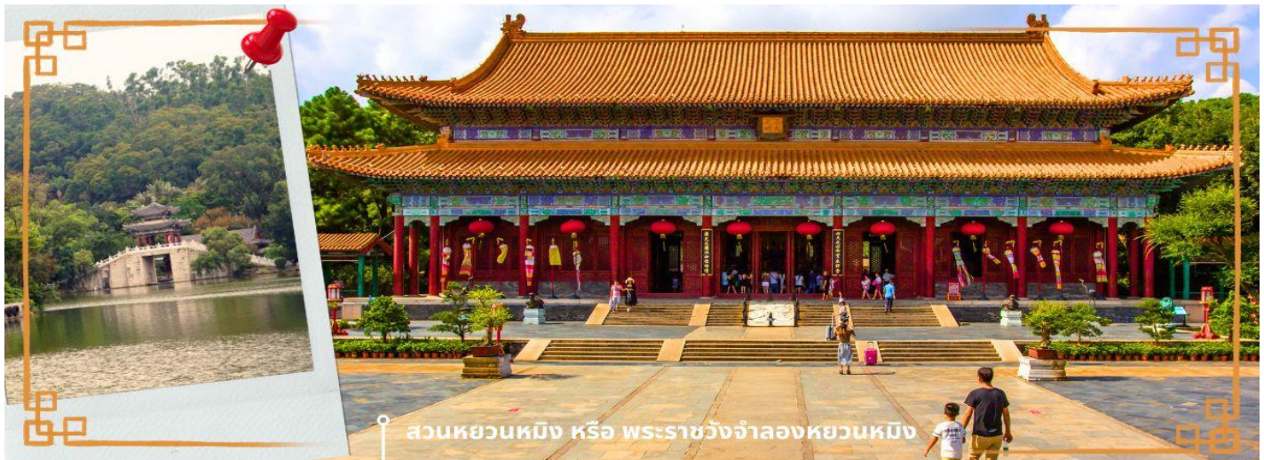
สวนหยวนหมิง หรือ พระราชวังจำลองหยวนหมิง

จากนั้นนำท่านสู่ ร้านหยก หยกในจีนโบราณจนมาถึงสมัยนี้ ยังมีความเชื่อว่าเป็นอัญมณีที่ล้ำค่าและหายาก บ่งบอกฐานะของสตรีในสมัยก่อน แต่ในสมัยนี้ เชื่อกันว่าหยกสีเขียวนั้นเหนียวนาโชคและความร่ำรวย ดังคำกล่าวที่ว่า“สีเขียวเหนียวทรัพย์” ถือเป็น การเสริมฮวงจุ้ยที่ดีของผู้สวมใส่อิสระให้ท่านได้เรียนรู้ชนิดของหยกและเลือกซื้อตามใจชอบ จากนั้นนำท่านสู่ สวนหยวนหมิง หรือ พระราชวังจำลองหยวนหมิง ตั้งอยู่ ณ ใจกลางหุบเขาซิลิน เมืองจูไห่ สร้างขึ้นเลียนแบบพระราชวังหยวนหมิง ณ กรุงปักกิ่ง สิ่งก่อสร้างต่างๆ มากกว่า 100 ชิ้น มีขนาดเท่าของจริงในอดีตทุกชิ้น อาทิ เสาหินคู่ สะพานข้ามธารทอง ประตูตึกง่าม ตำหนักเจิ้งต้ากวางหมิง สะพานเก้าเหลี่ยม สวนแห่งนี้โอบล้อมด้วยขุนเขาที่เขียวชอุ่ม และมีพื้นที่ครอบคลุมทะเลสาบขนาดมหึมา ซึ่งมีขนาดเท่ากับสวนเดิมในกรุงปักกิ่ง และยังมี การเพิ่มเติมและตกแต่งสวนที่เป็นศิลปะแบบตะวันตกผสมกับศิลปะจีน