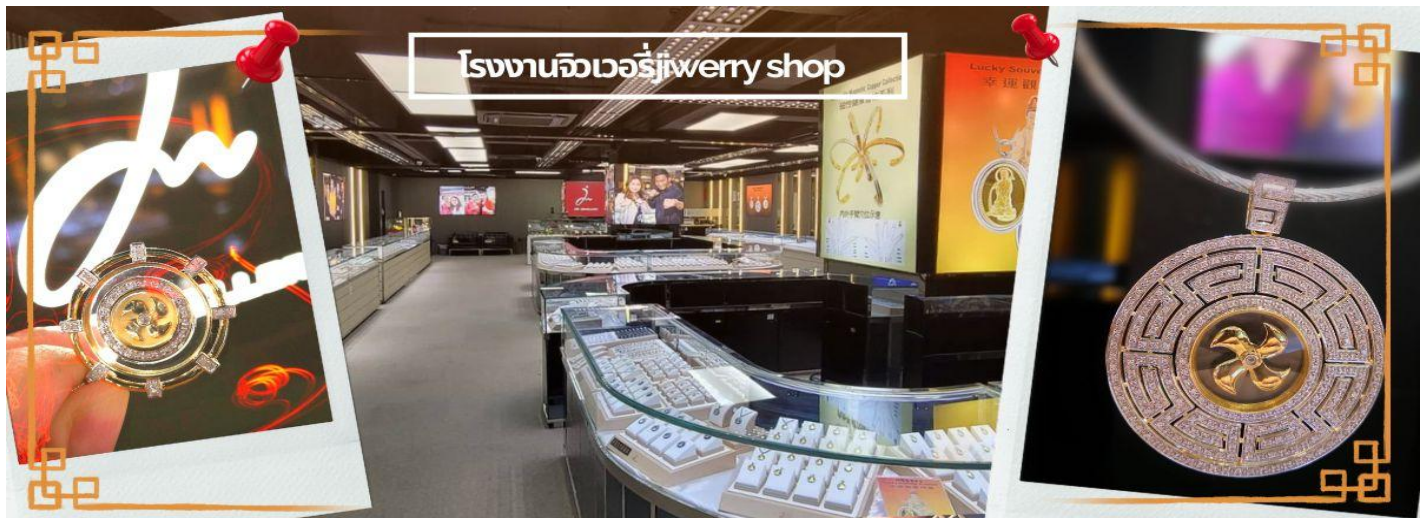
โรงงานจิวเวอรี่jewelry shop

จากนั้นนำท่านชม โรงงานจิวเวอรี่ ซึ่งเป็นโรงงานที่มีชื่อเสียงที่สุดของฮ่องกงในเรื่องการออกแบบเครื่องประดับ อาทิเช่น จี้ และแหวนกั้งหัน ที่สวยงามโดดเด่นไม่เหมือนใคร ซึ่งถือกำเนิดขึ้นที่นี่และมีชื่อเสียงที่สุดใช้เป็นเครื่องประดับติดตัว และเสริมดวงชะตา สินค้าทุกชิ้นมีเอกสารรับประกันคุณภาพเปลี่ยน ซ่อม ได้ตลอดอายุการใช้งาน หากเกิดการชำรุดจากสินค้าไม่ใช่ข้อบกพร่อง