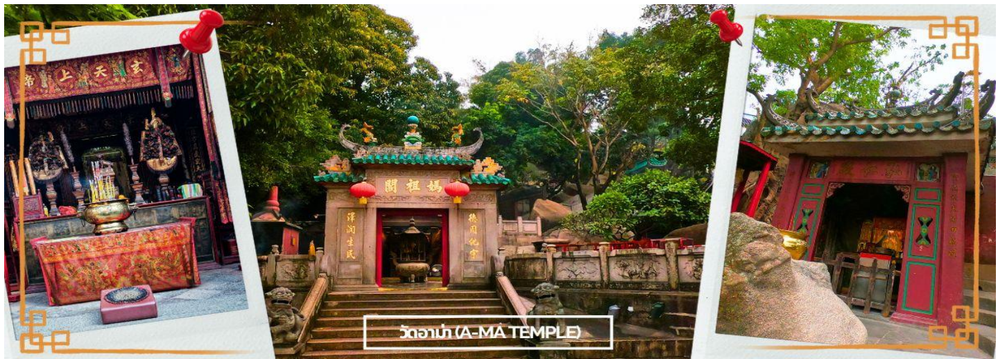
วัดอามา (A-MA TEMPLE)

จากนั้นนำท่านสู่ วัดอามา (A MA TEMPLE) หนึ่งในวัดสำคัญ ศักดิ์สิทธิ์ และเก่าแก่ที่สุดของมาเก๊า คนไทยคุ้นหูในชื่อศาลเจ้าแม่ทับทิม โด่งดังในการขอพรเรื่องหน้าที่การงาน การเงิน และความเป็นสิริมงคลแก่ชีวิต ใครที่ไปกราบไหว้ บูชา กลับมาชีวิตในการทำงาน การเงินก็จะดีขึ้น มีเทพศักดิ์สิทธิ์องค์ต่างๆ ซึ่งผสมความเชื่อทางพุทธศาสนา ลัทธิเต๋า คติความเชื่อพื้นบ้าน วัฒนธรรมประเพณี และความศรัทธา โดยตัววัดมีความเก่าแก่อย่างมาก ทำให้มีคุณค่าทางประวัติศาสตร์ จึงทำให้วัดแห่งนี้ กลายเป็นหนึ่งในสถานที่ ที่กำหนดไว้ในศูนย์ประวัติศาสตร์แห่งมาเก๊า แต่เดิมเชื่อกันว่าที่มาของชื่อ มาเก๊า มา