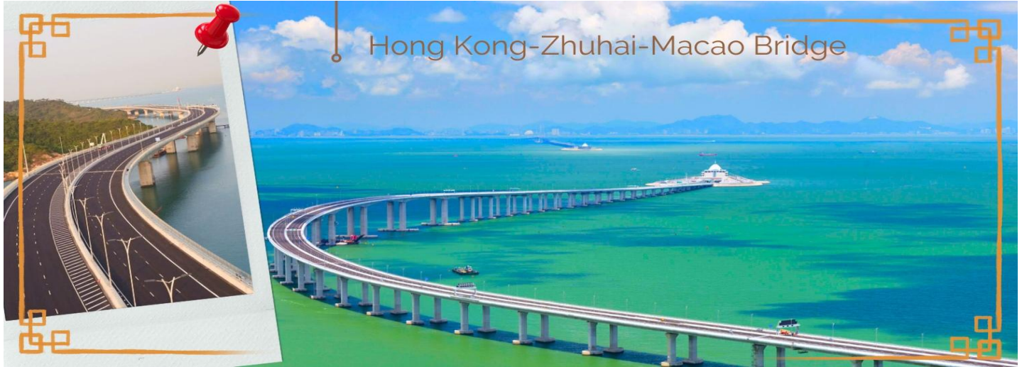
Hong Kong-Zhuhai-Macao Bridge

จากนั้นนำท่านเดินทางสู่ มาเก๊า (MACAU) หรือ เอ้าเหมิน (รถโค้ชปรับอากาศ) ด้วยการเดินทางผ่านเส้นทางสะพาน Hong kong – Zhuhai – Macao Bridge สะพานมีความยาว 55 กิโลเมตร ซึ่งเป็นสะพานข้ามทะเลที่ยาวที่สุดในโลก สะพานดังกล่าวเปิดใช้งาน เมื่อวันที่ 23 ต.ค. 2561 ซึ่งเชื่อมระหว่างเขตบริหารพิเศษฮ่องกง กับเมืองจูไห่ของมณฑลกวางตุ้ง และเขตบริหารพิเศษมาเก๊าของจีน โดยสะพานเส้นทางนี้นับเป็นครั้งแรก ที่จะช่วยลดระยะเวลาการเดินทางจากฮ่องกง ไปยังจูไห่และมาเก๊า จากเดิม 3 ชั่วโมง ให้เหลือเพียงภายใน 1 ชั่วโมง มาเก๊า มีชื่อทางการว่า เขตบริหารพิเศษมาเก๊าแห่งสาธารณรัฐประชาชนจีน เป็นพื้นที่บนชายฝั่งทางใต้ของประเทศจีน เป็นเขตปกครองพิเศษของจีน โดยมีฐานะเป็น เขตบริหารพิเศษภายใต้หลักการ หนึ่งประเทศสองระบบ ผู้ที่อาศัยอยู่ในมาเก๊าส่วนใหญ่พูดภาษากวางตุ้งเป็นภาษาแม่ ภาษาจีนกลาง ภาษาโปรตุเกส และภาษาอังกฤษ ชาวมาเก๊า มีความหมายโดยกว้างๆ คือผู้ที่พำนักอาศัยถาวรอยู่ในมาเก๊า ส่วนในวงแคบ หมายถึง คนพื้นเมืองในมาเก๊าที่สืบทอดมาจากชาวโปรตุเกส มักจะผสมกับชาวจีนและบรรพบุรุษชาติอื่นๆ