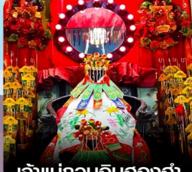
เจ้าแม่กวนอิมสองฮา