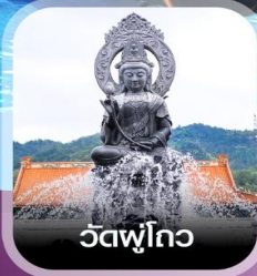
วัดฟูโกว