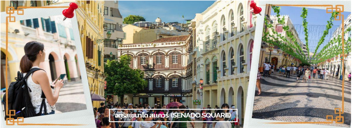
จัตุรัสเซเนโด สแควร์ (SENADO SQUARE)