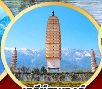
เจดีย์สามองค์