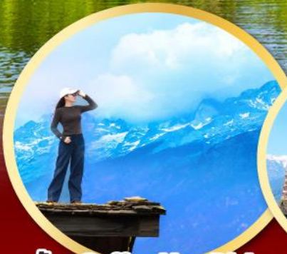
ร้าน Coffee Yun Di An