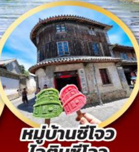
หมู่บ้านซีโจว ไอติมซีโจว