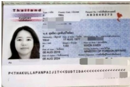
ตัวอย่าง หน้าพาส ยื่น VISA EGYPT