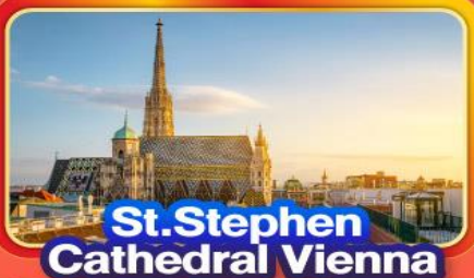
St. Stephen Cathedral Vienna