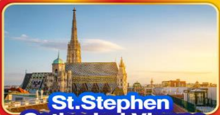
St. Stephen Cathedral Vienna