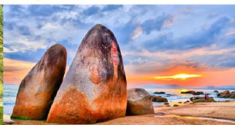
วนอุทยานสุดขอบฟ้า

*ทางบริษัทฯ ขอสงวนสิทธิ์ในการสลับโปรแกรมทัวร์ตามความเหมาะสมขึ้นอยู่กับสถานการณ์หน้างาน โดยคำนึงถึงผลประโยชน์ของลูกค้าเป็นสำคัญ