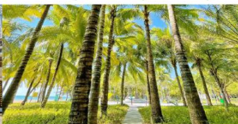
ทางเดินมะพร้าว