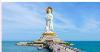
เจ้าแม่กวนอิมหนานชาน