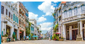
ถนนโบราณฉีหลว