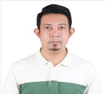
( ตัวอย่างรูปถ่าย )