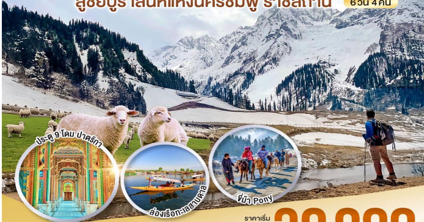
ประตู่ 9 โดม ปาตริกา

มงกุฎเพชรแห่งอินเดีย กลางอ้อมกอดหิมาลัย สู่ชัยปุร์ เสน่ห์แห่งนครชมพู ราชสถาน 6 วัน 4 คืน