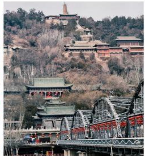
สะพานเหล็กแม่น้ำเหลืองจงซาน (Zhongshan Bridge)