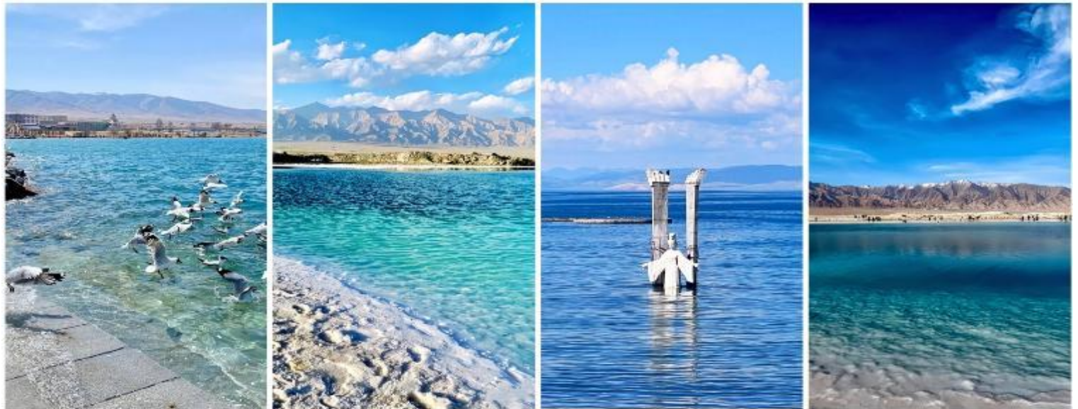
ทะเลสาบชิงไห่ (Qinghai Lake)

บ่าย นำท่านเดินทางสู่เมืองซหิง ใช้เวลาเดินทางประมาณ 3 ชั่วโมง ระหว่างทางนำท่านแวะชม ภูเขาพระอาทิตย์และดวงจันทร์ (Riyue Mountain) เป็นหนึ่งในสถานที่ท่องเที่ยวที่มีชื่อเสียงของเมืองซหิง ภูเขาที่มีความเกี่ยวข้องกับเส้นทางสายไหมและตำนานเกี่ยวกับเจ้าหญิงเหวินเจิง (文成公主) แห่งราชวงศ์ถัง ที่เดินทางผ่านบริเวณนี้ไปยังทิเบตเพื่ออภิเษกสมรสกับกษัตริย์ซงชานกัมโป (Songtsen Gampo) ภูเขานี้ตั้งอยู่ที่ระดับความสูงประมาณ 3,500 เมตรเหนือระดับน้ำทะเล มีทุ่งหญ้าเขียวขจี ทิวทัศน์ของภูเขาสูง และอากาศที่สดชื่น มีชมประติมากรรมและสถาปัตยกรรมที่ได้รับอิทธิพลจากวัฒนธรรมทิเบต รวมถึงรูปปั้นและสัญลักษณ์แห่งสันติภาพ จากนั้นนำท่านสู่ ตลาดกลางคืนโมจา หรือ Mojia Street Night Market เป็นหนึ่งในสถานที่ท่องเที่ยวที่ได้รับความนิยมอย่างมากในเมืองซหิง ประเทศจีน ตลาดแห่งนี้เป็นมากกว่าแค่ตลาดกลางคืนทั่วไป เพราะเป็นศูนย์รวมของ