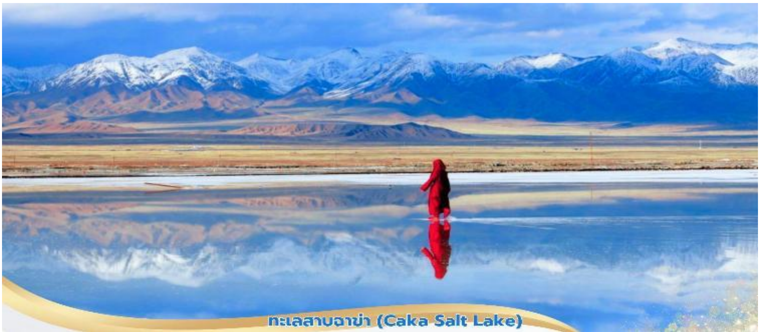
ทะเลสาบฉาซ่า (Caka Salt Lake)

วันที่สี่ ฉาซ่า - ทะเลสาบชิงไห่ - ภูเขาพระอาทิตย์และดวงจันทร์ - ชิงหนิง - ตลาดกลางคืนโมจา