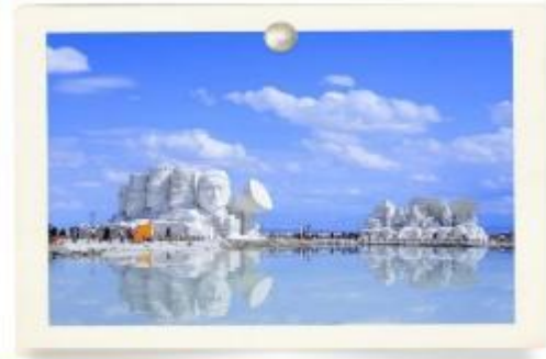
ทะเลสาบเกลือซาก่า (Caka Salt Lake)