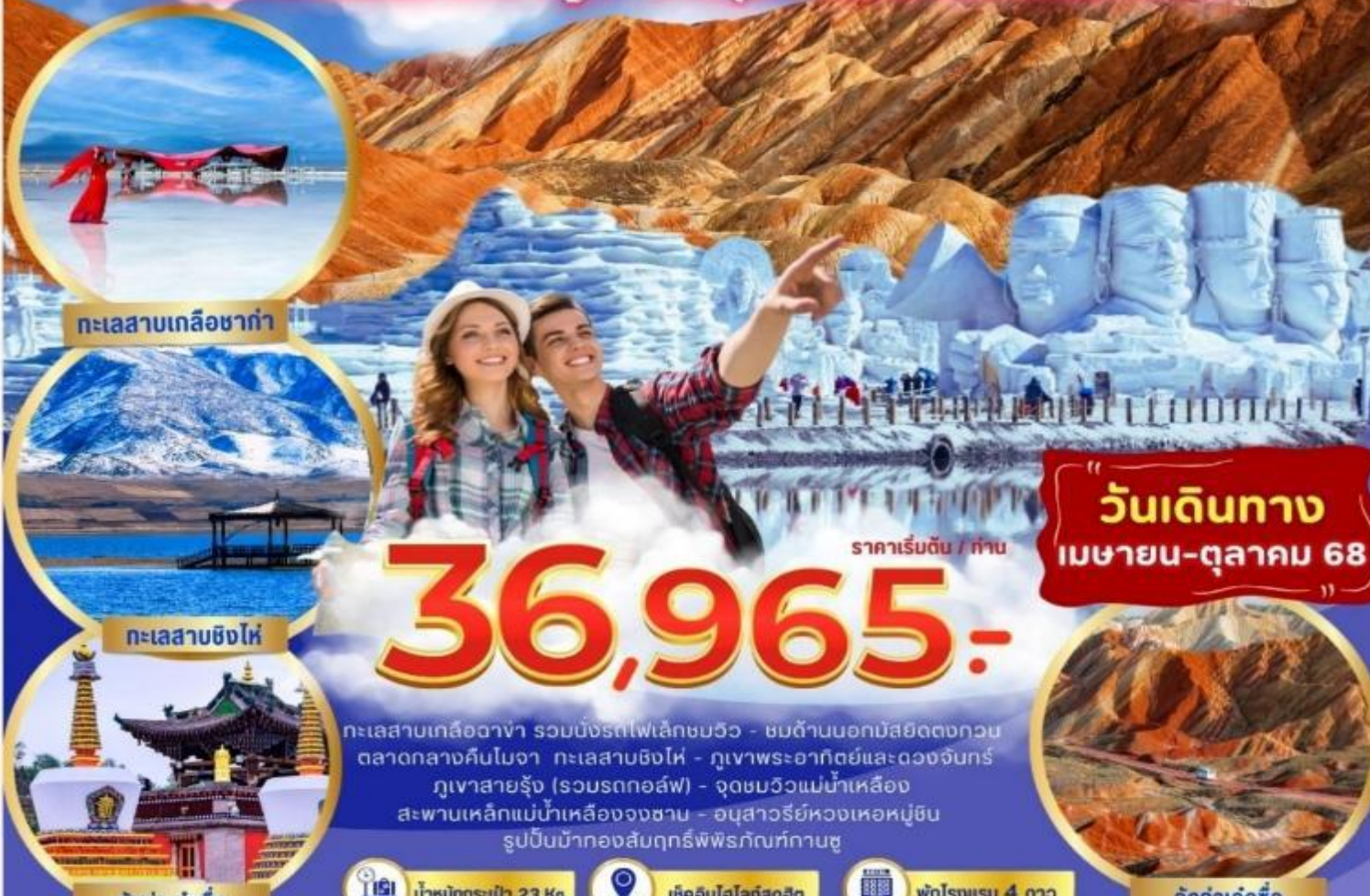
ทะเลสาบเกลือซาก้า

ทะเลสาบ 3000 ปี ฉางท่า ภูเขาสายรุ้งจางเจี๋ย ชมวิวแม่น้ำสองสี