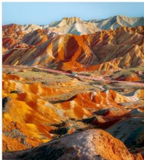
อุทยานภูเขาสายรุ้ง