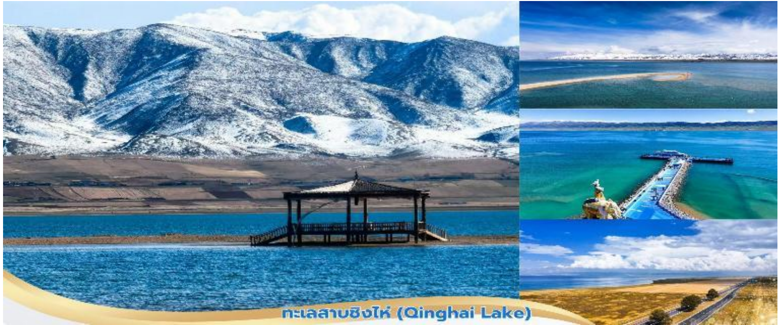
ทะเลสาบชิงไห่ (Qinghai Lake)