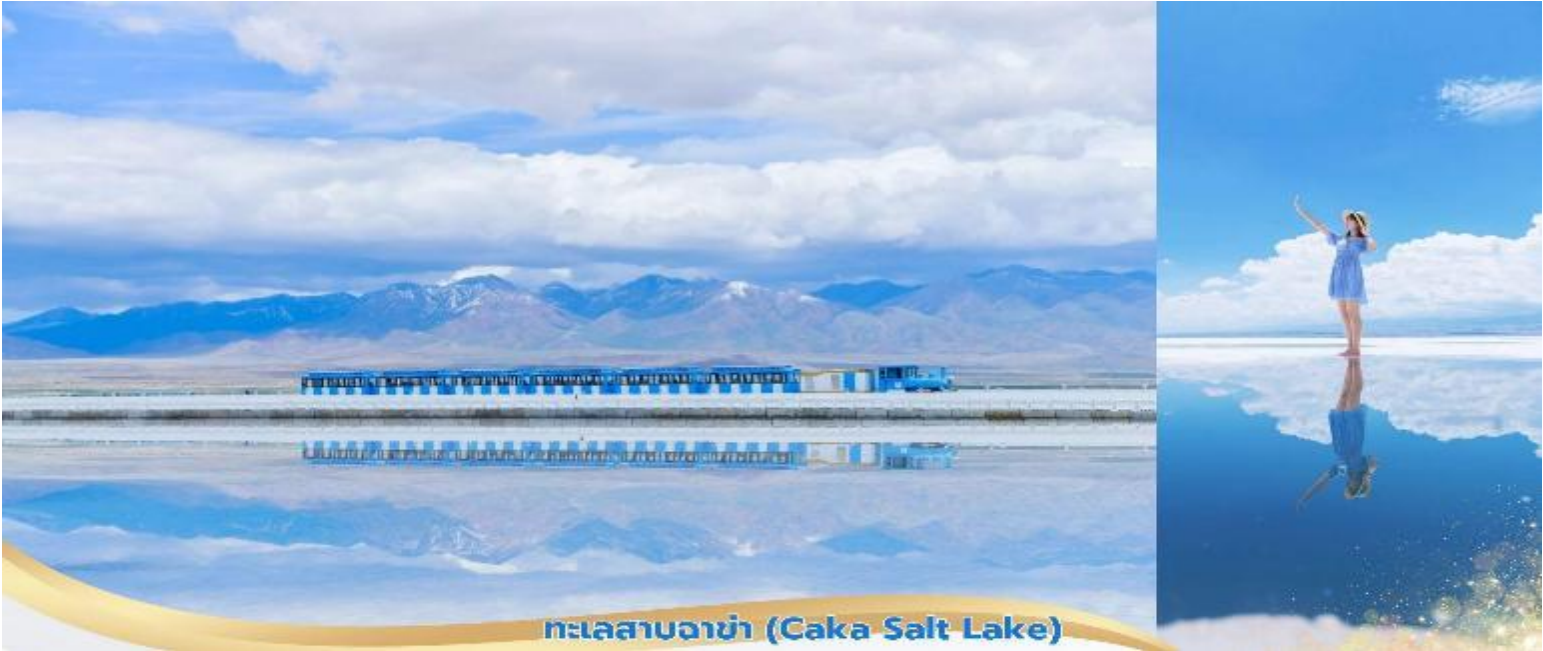
ทะเลสาบฉางช่า (Caka Salt Lake)

เช้า บริการอาหารเช้า ณ ห้องอาหารของโรงแรม จากนั้นนำท่านเดินทางต่อไปยังเมืองฉางช่า Caka ใช้เวลาเดินทางประมาณ 4 ชั่วโมง ระหว่างให้ท่านได้เพลิดเพลินกับวิวทิวทัศน์อันสวยงาม เที่ยง บริการอาหารกลางวัน ณ ภัตตาคาร บ่าย นำท่านชม ทะเลสาบเกลือฉาก่า (Caka Salt Lake) หรือที่รู้จักในชื่อ "กระจกแห่งสวรรค์" ทะเลสาบนี้มีชื่อเสียงจากน้ำใสสะอาดที่สะท้อนท้องฟ้าและภูเขาโดยรอบราวกับกระจกขนาดยักษ์ที่สะท้อนโลกกลับหัวอย่างสวยงาม พิเศษ... นั่งรถไฟเล็กชมวิวทะเลสาบ ชมความงามทะเลสาบปกคลุมด้วยคริสตัลเกลือสีขาวบริสุทธิ์ ในบางจุดยังสามารถเดินบนพื้นเกลือที่แข็งตัวได้อีกด้วย