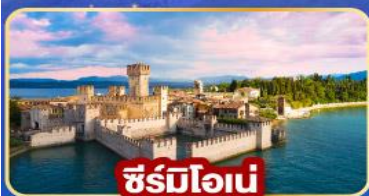
ซิริมิโอนี