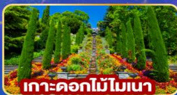
เกาะดอกไม้โมเนา