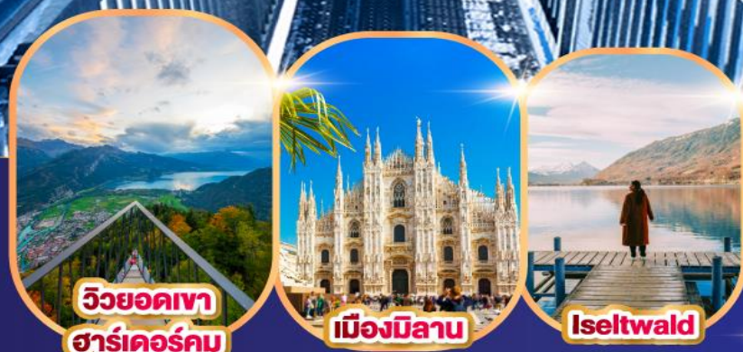
วิวยอดเขา ชาร์เคอร์คুম