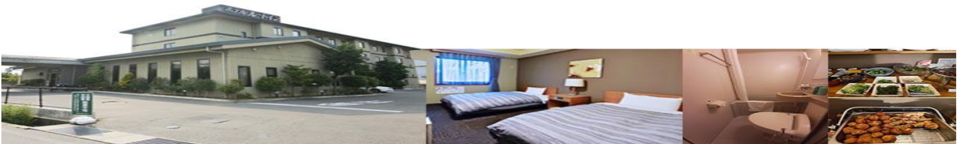
Hotel Route-Inn Court Azumino Toyoshina Ekiminami or Similar

วันที่ 3 คามิโคจิ - ปราสาทมัตสึโมโต้ - หมู่บ้านน้ำใส โอชิโนะฮักได