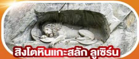
สิงโตหินแกะสลัก ลูซิิร์น