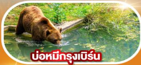
บ่อหมีกรุงเบิร์น