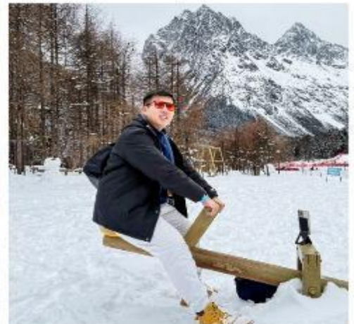
อุทยานแห่งชาติปีเฟิงโกว

บ่าย นำท่านชม อุทยานแห่งชาติปีเฟิงโกว (Bipenggou National Park) ได้รับการจัดอันดับให้เป็นสถานที่ท่องเที่ยวระดับ AAAA ระดับชาติมีความอุดมสมบูรณ์ของป่าไม้ มีความหลากหลายทางภูมิทัศน์ และระบบนิเวศเป็นอย่างมาก และเป็นจุดชมธรรมชาติในช่วงฤดูใบไม้เปลี่ยนสีอีกแห่งที่ได้รับความนิยมเป็นอย่างมาก ชมธรรมชาติและทัศนียภาพอันงดงามภายในอุทยานซึ่งเปลี่ยนแปลงไปตามฤดูกาล ช่วงฤดูใบไม้เปลี่ยนสีต้นไม้ต่างๆ เปลี่ยนแปลงสีจากเขียวเป็นเหลืองทอง, ส้ม และแดงกระจัดกระจายไปทั่วทั้งหุบเขาและในฤดูหนาวปกคลุมด้วยหิมะสีขาว, เกล็ดน้ำแข็งเกาะเกี่ยวตามกิ่งก้านดูสวยงามแปลกตา สมควรใช้เวลานำท่านเดินทางต่อไปยังเมืองแม่เสียน