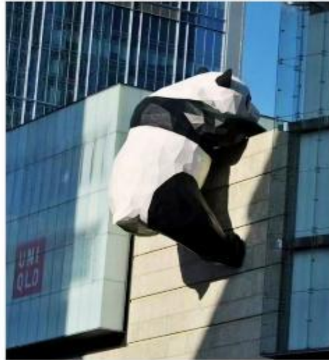
หมีแพนด้ายักษ์