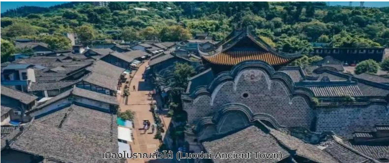
เมืองโบราณลั่วไต้ (Luodai Ancient Town)

สมควรแก่เวลา นำท่านเดินทางสู่ สนามบินเมืองเทียนฟู่ เดินทางกลับสู่ ประเทศไทย