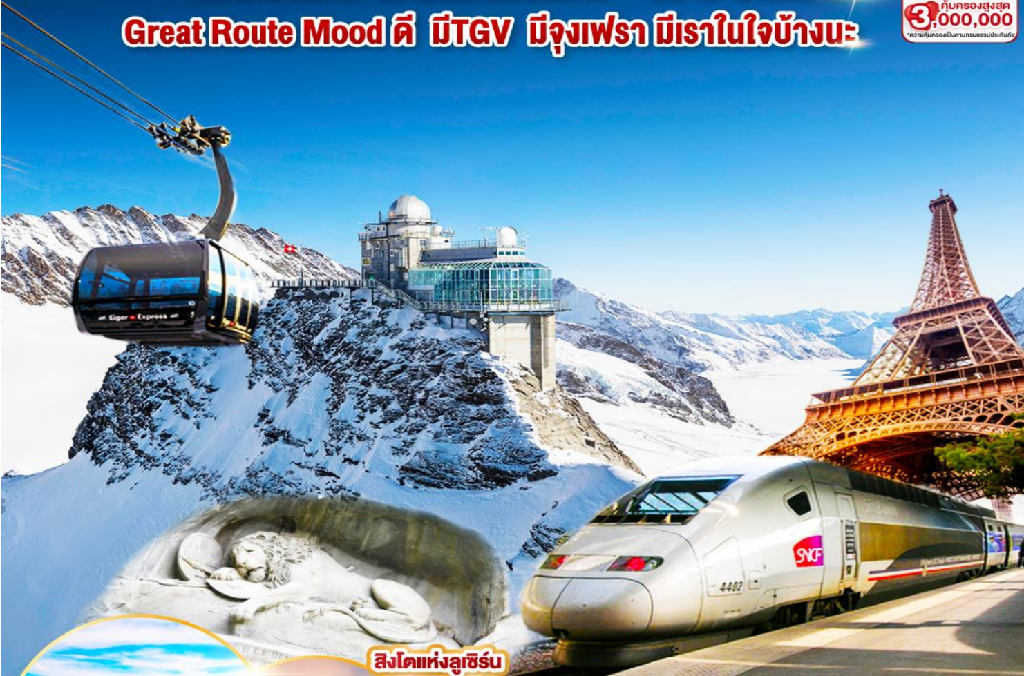
สิงโตแห่งลูเซิร์น

ประกันสุขภาพและอุบัติเหตุ คุ้มครองสูงสุด 3,000,000 ความคุ้มครองในนามบริษัทประกันภัย