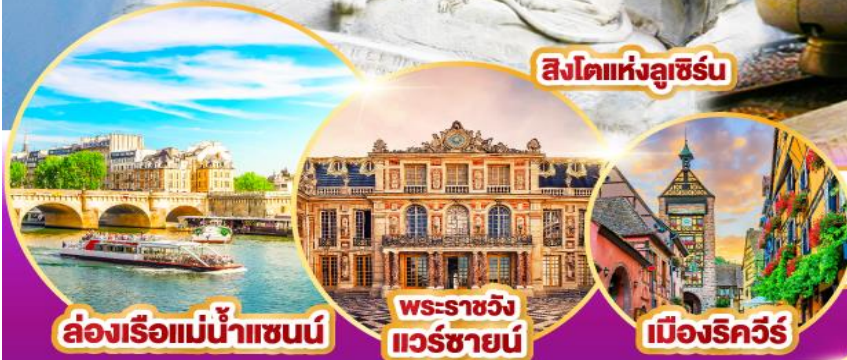
ล่องเรือแม่น้ำแซนน์