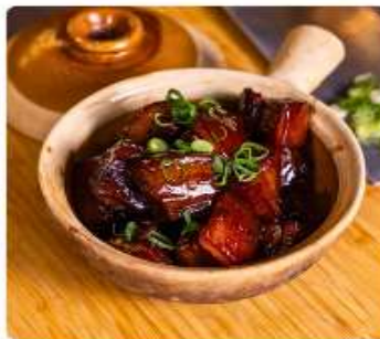
หมูพันปี