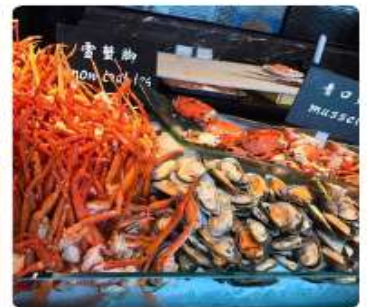
บุฟเฟ่ต์ซีฟู้ด