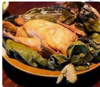
ไก่ขอกาน