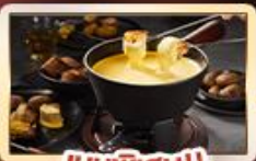
เมนูพิเศษ!! สวิสฟองดู

เบิร์น เวเวย์ เซอร์แมท อินเทอร์ลาเกน ทิตลิส ลูเซิร์น ซูริก