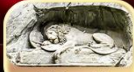
สิงโตหินแกะสลัก