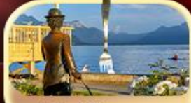
ชาลี แชปลิน THE FORK