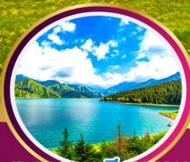
ทะเลสาบเทียนชาน