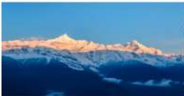
กูเขาหิมะเหมยลี่