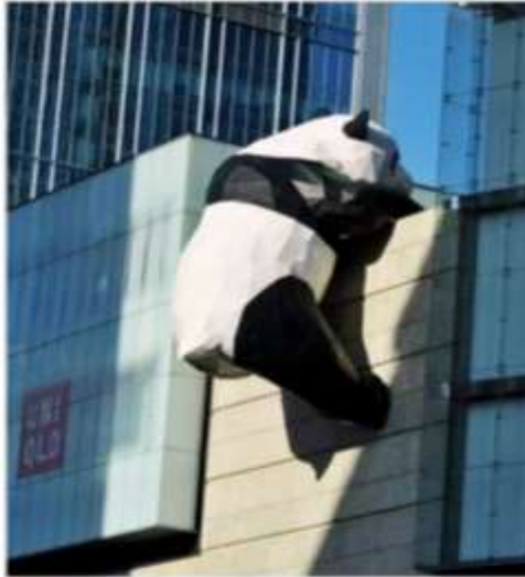
หมีแพนด้ายักษ์