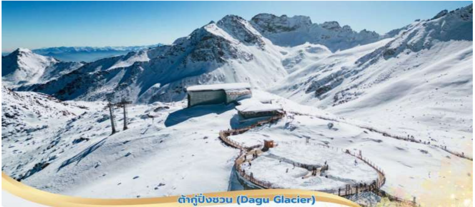
ต้ากู่ปิงชว่น (Dagu Glacier)