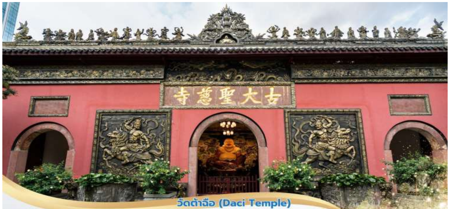
วัดต้าจื่อ (Daci Temple)

จากนั้นนำท่านชม สวนสวรรค์แห่งดอกไม้ Manhua Manor เป็นแหล่งท่องเที่ยวพักผ่อนชมดอกไม้ที่มีรูปแบบที่โดดเด่นและขนาดใหญ่ในเขตชานเมืองเจิ้งตูเป็นที่รู้จักในนาม "เมืองดอกไม้" ของเจิ้งตูและ "สวนหลังบ้านของชาวเจิ้งตู" ยังเป็นหนึ่งในสี่ทะเลดอกไม้ที่ใหญ่ที่สุดในประเทศจีนครอบคลุมพื้นที่กว่า 600 เอเคอร์และมีชื่อเสียงไปทั่วประเทศและต้อนรับนักท่องเที่ยวมากกว่าหนึ่งล้านคนทุกปี มีชื่อเสียงในด้านดอกไม้และมีทัศนียภาพสวนดอกไม้ที่สวยงามทุกฤดูกาล ในฤดูใบไม้ผลิ ทัศนียภาพที่นำเข้ามาจากเนเธอร์แลนด์จะบานสะพรั่งพร้อมกับดอกไม้กว่าพันชนิด เช่น ดอกซากุระ ดอกโบตั๋น และดอกกุหลาบมากกว่า 700 ชนิดจะบานสะพรั่ง ฤดูใบไม้ร่วงสีทองของดอกทิวลิปนับล้านดอกหลากสีสร้างเป็นดอกไม้แปลกตาพร้อมกับดอกดาเลียหลากสี ในฤดูหนาวมีดอกไม้มากกว่า 100 ชนิด เช่น ดอกป๊อปอายไอซ์แลนด์ และดอกไวโอลิน มีดอกไม้มากกว่า 5,000 สายพันธุ์และดอกไม้มากกว่า 3 ล้านดอกตลอดทั้งปี *หมายเหตุ การบานของดอกไม้ขึ้นอยู่กับสภาพอากาศ จากนั้นเดินทางไปยัง วัดต้าจื่อ เป็นวัดเก่าแก่ที่มีอายุยาวนานกว่า 1,600 ปี ตั้งอยู่ใจกลางของ Chengdu ที่นี่ถือเป็นสถานที่สำคัญที่น่าสนใจ เพราะเป็นวัดที่พระถังซัมจั๋งบวชเป็นพระภิกษุก่อนจะย้ายไปจำพรรษา ยังวัดอื่นภายในวัดต้าจื่อนั้นเงียบสงบ