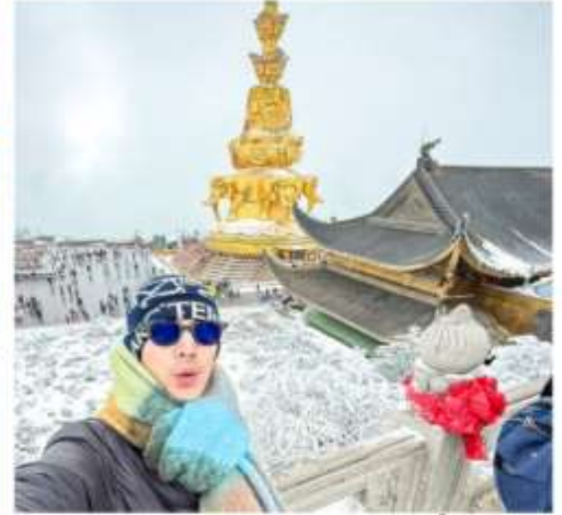
ยอดเขาจินตึง เขาเอ๋อเหมย์