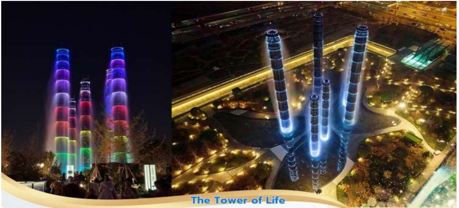
The Tower of Life

หลังอาหารค่ำ นำท่านชมแสงสี The Tower of Life ลานห้าง SKP RIGHTWAY HOTEL ระดับ 5*จีน หรือเทียบเท่า