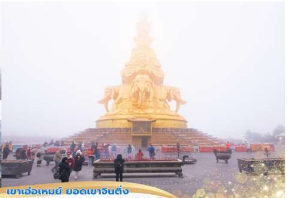
เขาเอ๋อเหมย์ ยอดเขาจินตึง

คำ บริการอาหารค่ำ ณ ภัตตาคาร เมนูพิเศษ...สุกี้เสฉวน