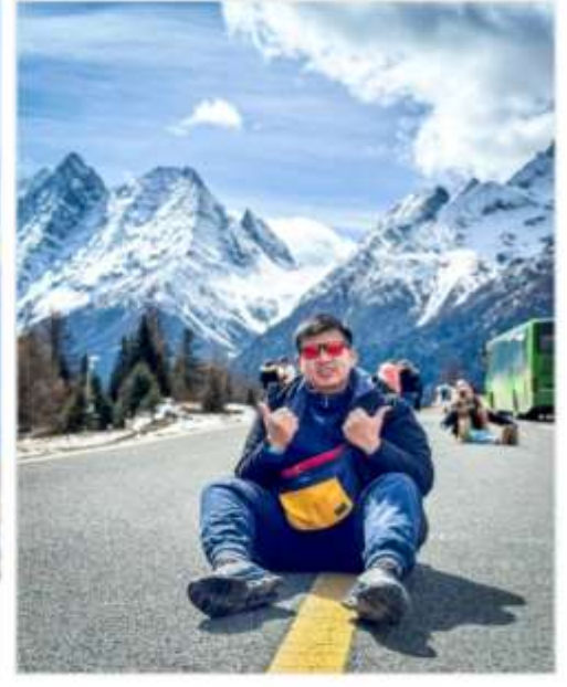
เขาสีดรุณี (Siguniang)