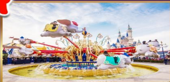
GARDENS OF IMAGINATION