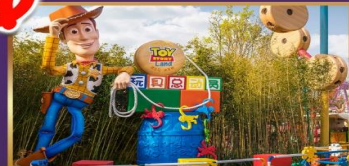
TOY STORY LAND