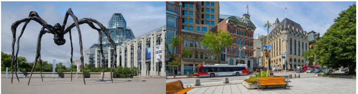
BIG...GRAND CANADA 13D10N JULY-OCTOBER 2025 By CX

นำท่านเดินทางสู่ เมืองออตตาวา(Ottawa) เป็นเมืองหลวงของแคนาดา เป็นศูนย์กลางทางการเมืองของแคนาดาและสำนักงานใหญ่ของรัฐบาลกลาง เมืองนี้เป็นที่ตั้งของสถานทูตต่างประเทศ อาคารสำคัญ องค์กร และสถาบันของรัฐบาลแคนาดา เป็นที่ตั้งของวิทยาลัยและมหาวิทยาลัยหลายแห่ง สถาบันวิจัยและวัฒนธรรม เมืองออตตาวาเป็นหนึ่งในเมืองที่ได้รับการเยี่ยมชมมากที่สุดในแคนาดา โดยมีนักท่องเที่ยวมากกว่า 11 ล้านคนต่อปี เมื่อถึงแล้วนำท่านถ่ายรูปด้านหน้า หอศิลป์แห่งชาติแคนาดา(National Gallery of Canada) เป็นพิพิธภัณฑ์ศิลปะแห่งชาติของแคนาดาอาคารของพิพิธภัณฑ์ครอบคลุมพื้นที่ 46,621 ตารางเมตร สำหรับจัดแสดงงานศิลปะ เป็นหนึ่งในพิพิธภัณฑ์ศิลปะที่ใหญ่ที่สุดในอเมริกาเหนือ บริเวณด้านหน้าหอศิลป์มีจุดถ่ายรูปที่น่าสนใจคือ รูปปั้นแมงมุมยักษ์ (Maman) ต่อมนำท่านถ่ายรูปอาคารรัฐสภา ( Parliament of Canada ) เป็นสภานิติบัญญัติของรัฐบาลกลางของแคนาดา ตั้งอยู่ที่ Parliament Hill ในออตตาวา โดยภายในประกอบด้วยอาคารสไตล์โกธิกฟื้นฟูหลายหลัง ซึ่งองค์ประกอบทางสถาปัตยกรรมได้รับการคัดเลือกมาเพื่อรำลึกถึงประวัติศาสตร์ของประชาธิปไตยในระบบรัฐสภา