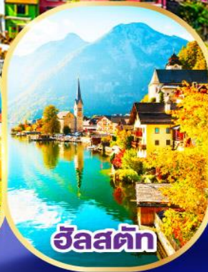
ซาลซ์ทัก