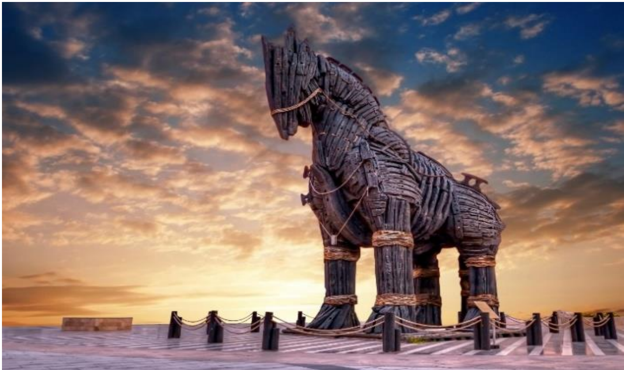
นำท่านชมและถ่ายภาพ ม้าไม้จำลองเมืองทรอยริมทะเล (TROJAN STATUE/HOLLYWOOD HORSE) เป็นม้าไม้ที่มีชื่อเสียงโด่งดังมากที่สุดจากมหากาพย์ภาพยนตร์ฮอลลีวูดเรื่อง ทรอย (Troy) ในปี 2004 มีแบรด

DAY 2 ม้าไม้จำลองเมืองทรอยริมทะเล – เมืองคูซาดาชี – เมืองโบราณเอฟฟีซุส (B/L/D) เช้า บริการอาหาร ณ ห้องอาหารของโรงแรม