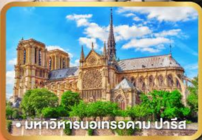
• มหาวิหารนอเทรอดาม ปารีส