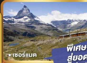
• เซอร์แมต