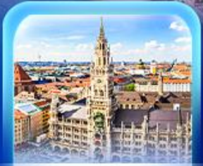
จัตุรัสมาเรียนพลัทซ์

เวียนนา ปราสาทนอยชวาสไตน์ ลูเซิร์น ซอร์แมท ชุก ซูริก