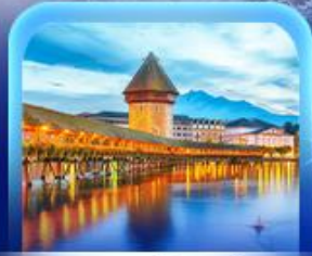
สะพานไมซ์าเป