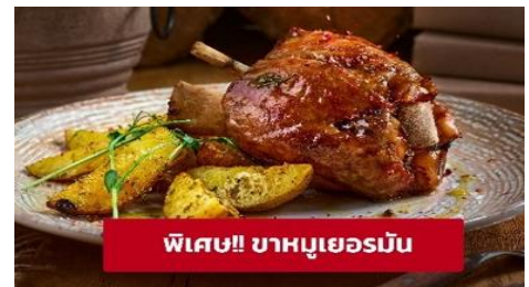
พิเศษ!! ขาหมูเยอรมัน

Highlight! เมื่อถึงที่ต้องได้ชิม ขาหมูเยอรมัน (German Pork Knuckle) เมนูที่โด่งดังทั่วโลกและเป็นเมนูโปรดของใครหลายๆ คน