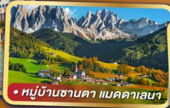
• หมู่บ้านซานตา แมดคาเลนา