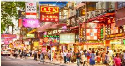
ย่านจิมซาจุ่ย