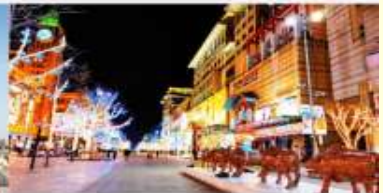
ถนนหวงฝูจิ่ง

*ทางบริษัทฯ ขอสงวนสิทธิ์ในการสลับโปรแกรมทัวร์ตามความเหมาะสมขึ้นอยู่กับสถานการณ์หน้างาน โดยคำนึงถึงผลประโยชน์ของลูกค้าเป็นสำคัญ