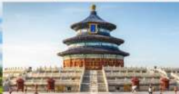
หอสังเกตการณ์เทียนถาน