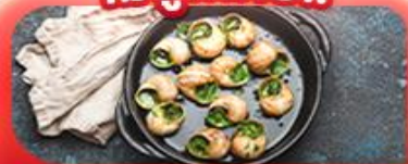
เซอเอสคาโท