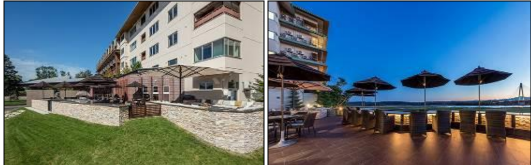
นำท่านเข้าสู่ที่พัก TOKACHIGAWA ONSEN DAIICHI HOTEL