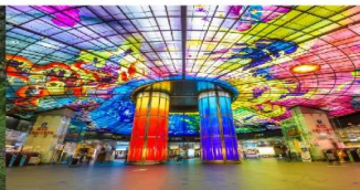
Dome of Light