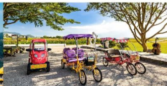
ปั่นจักรยานเล่นที่ Mr. Brown Avenue

*ทางบริษัทฯ ขอสงวนสิทธิ์ในการสลับโปรแกรมทัวร์ตามความเหมาะสมขึ้นอยู่กับสถานการณ์หน้างาน โดยคำนึงถึงผลประโยชน์ของลูกค้าเป็นสำคัญ