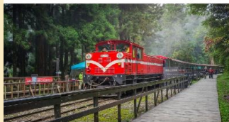
อุทยานแห่งชาติอาลีซาน