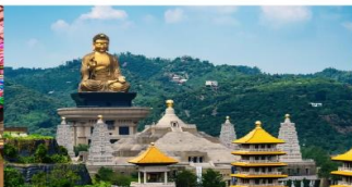
วัดผอกวงซาน